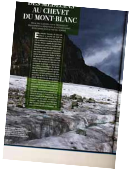
Géo -fév 2015

www.creamontblanc.org/fr/espace-presse/revue-de-presse/