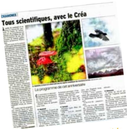
Dauphiné Libéré - oct 2014