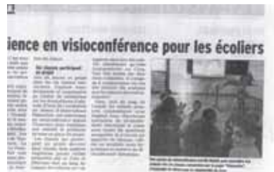
Dauphiné Libéré - oct 2014