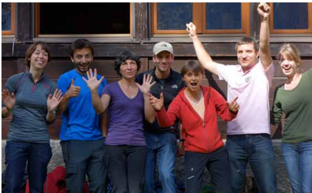
L'équipe au complet

Après une première manche remportée en 2013 avec l'appui de ses nombreux soutiens, le CREA reste dans ses locaux de l'Observatoire et celui-ci gardera sa vocation scientifique. La Commune de Chamonix a voté fin 2014 le rachat de l'Observatoire, l'acte d'achat devant être signé en 2015.