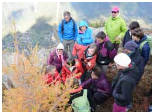
Une réflexion et des expérimentations de terrain au cœur de la science citoyenne !

Ces protocoles doivent être rigoureux mais réalisables par tout un chacun, en randonnée accompagnée ou en autonomie.