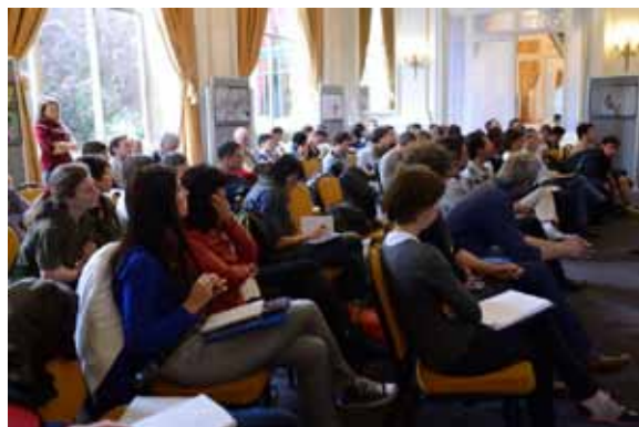
Pleinière lors des 10 ans de Phénoclim - RDV du CREA 2014 à Chamonix